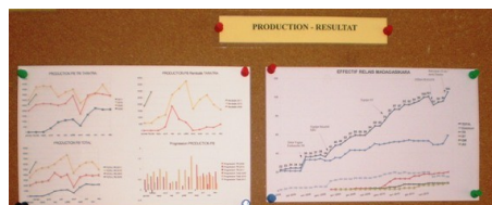
Indicateurs et stratégie

Accessoirement, on a aussi travaillé, et de manière méthodique, jugez-en par la suite !