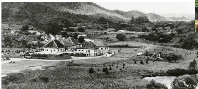
La station thermale de Ranomafana en 1953 A droite, la restauration de l'annexe 1 délabrée