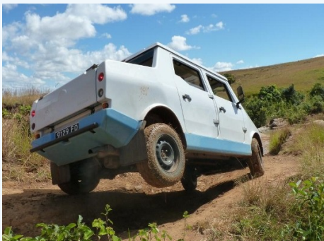
MAZANA II en exploration-test sur les routes de son natal !