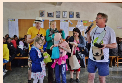
Remise des petits cadeaux en guise de souvenir de la part des équipes

« N'allez pas là où le chemin peut mener. Allez là où il n'y a pas de chemin et laissez une trace »