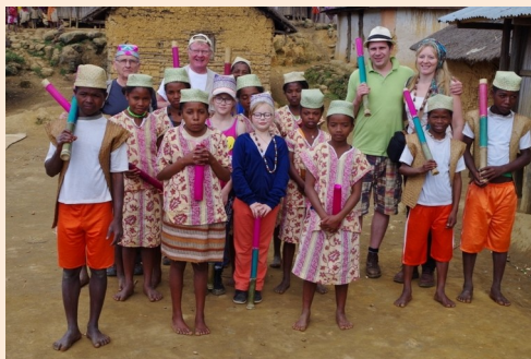
Pose photo avec les danseurs et danseuses au village Tanala