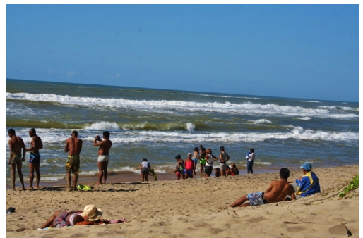
Le voyage découverte annuel des mpiaramiasa* fin du mois de juillet dernier.