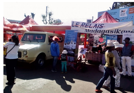
FIOVA 2016 à Antsirabe

Même ampleur que FIER MADA, FIOVA a pu regrouper une centaine d'entreprises et acteurs économiques à Madagascar.