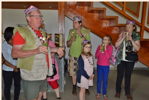
Accueil à l'hôtel Thermal Ranomafana