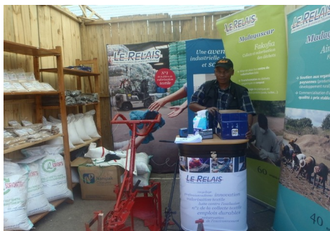
FIER MADA 2016 à Antananarivo

Dans cette même perspective, la 18ème édition FIOVA (Fiombonanan'ny Orinasan'ny Vakinakaratra) s'est tenue le 8 au 10 septembre dernier à Antsirabe, la région la plus productive de l'île. Le Relais a participé à travers la Karenjy, les hôtels et l'agri pour témoigner des valeurs socio-économiques de l'entreprise.