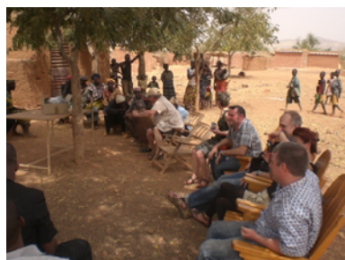
La délégation France de février