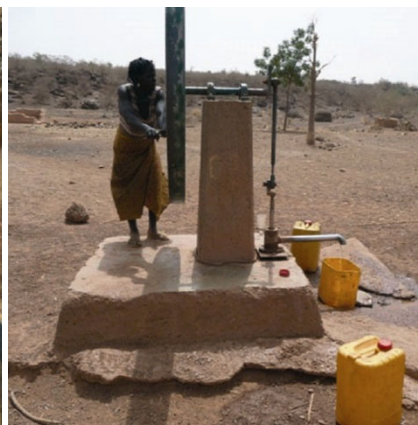
La première pompe à eau