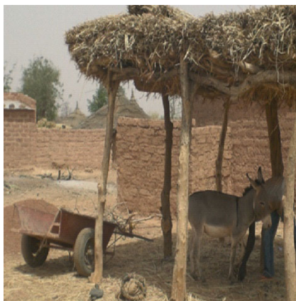
Une charrette avec son âne