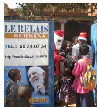
Noël des enfants du quartier et du personnel à Ouagadougou