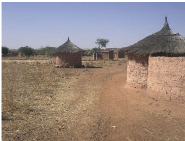
Bienvenue à Yalga !