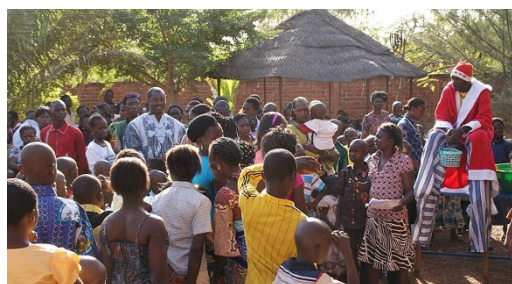
Noël des enfants au Centre de tri à Koudougou