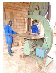
Espace de travail bois massif