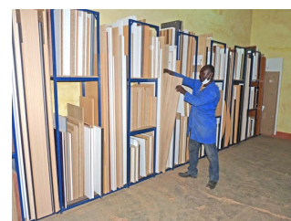
Rangements des stocks