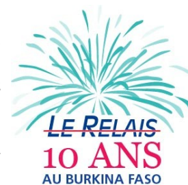
Le logo des 10 ans

L'invitation est lancée ! Les 10 ans du Relais Burkina sont l'affaire de tous. Pour cette occasion, l'organisation est de taille pour que la fête soit réussie, mais surtout pour que tous les salariés des projets au Burkina s'impliquent ! 10 commissions d'organisation se sont mises en place et sont déjà en effervescence depuis quelques mois. 4 commissions s'occupent de l'organisation autour des 10 ans : communication, budget, logistique, protocole et planning (pour les parrainages et les invitations). Les autres commissions sont chargées d'organiser les événements choisis par les salariés pour fêter les 10 ans. La commission atelier Koudougou, jumelée avec la commission sport proposera des ateliers, des jeux et olympiades, pour des échanges entre salariés. La commission solidarité réfléchit à des actions solidaires à réaliser en commun. La commission festivité s'occupe notamment de trouver des idées pour la soirée finale, et la commission historique a pour fonction de retracer l'histoire du Relais, avec des questions de fond : comment sommes nous arrivés là ? Et quelle direction empruntons-nous ? Vivement janvier prochain !