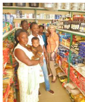
Sortie de terrain dans une alimentation de Ouaga