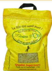
Le nouvel emballage du sac de 5kg Grains d'Or

« Le mois de février a été tourné vers la formation des équipes. Nous avons eu la chance d'accueillir deux formatrices, venues de France dans le cadre d'un congé solidaire, par l'intermédiaire de l'ONG Planète Urgence. Valérie a animé une formation sur la sécurité au travail, suivie par près d'une trentaine d'agents des différents projets du Relais. Albane a aussi animé une formation multi-projets, cette fois-ci à destination des commerciaux. Le contenu, la qualité des formatrices et les échanges entre équipes de différents projets ont été très appréciés par les salariés. Tous sont repartis avec plein d'idées en tête et beaucoup de motivation pour les mettre en pratique ! » Jean Baptiste LUQUIAU, Coordinateur