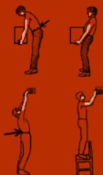
Quelques réflexes « sécurité » pour éviter les risques