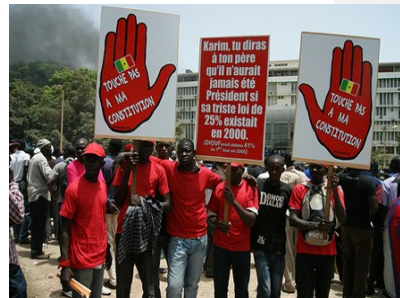
Manifestants devant l'Assemblée Nationale à Dakar

A huit mois de la prochaine élection présidentielle, prévue en février 2012, le parlement sénégalais devait voter une énième modification de la Constitution. Le projet de loi consistait en une modification qui devait permettre d'élire simultanément un président et un vice-président « à l'américaine »