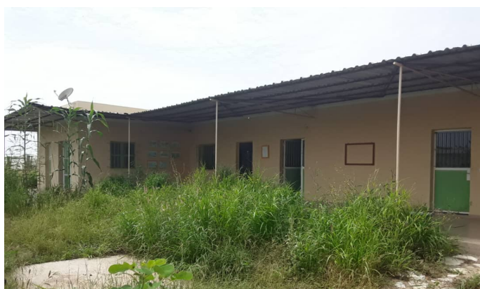
Le bâtiment de transformation, stockage