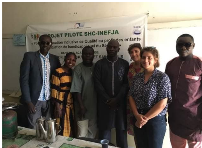
Sensibilisation avec l'infirmière de la MdA