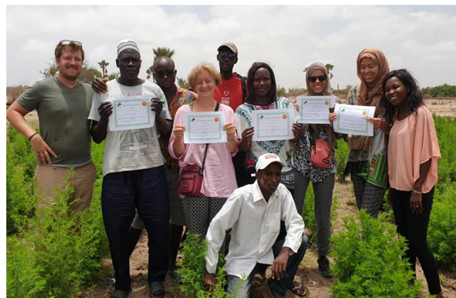
Formation à la culture de l'Artemisia