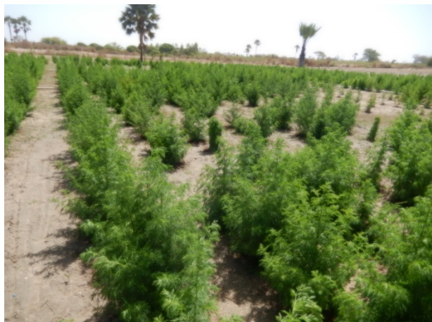
Les plantations d'annua

Elle est autonome financièrement au niveau des frais de fonctionnement mais a encore besoin de soutien pour des investissements importants comme ceux qui font l'objet de ce projet.